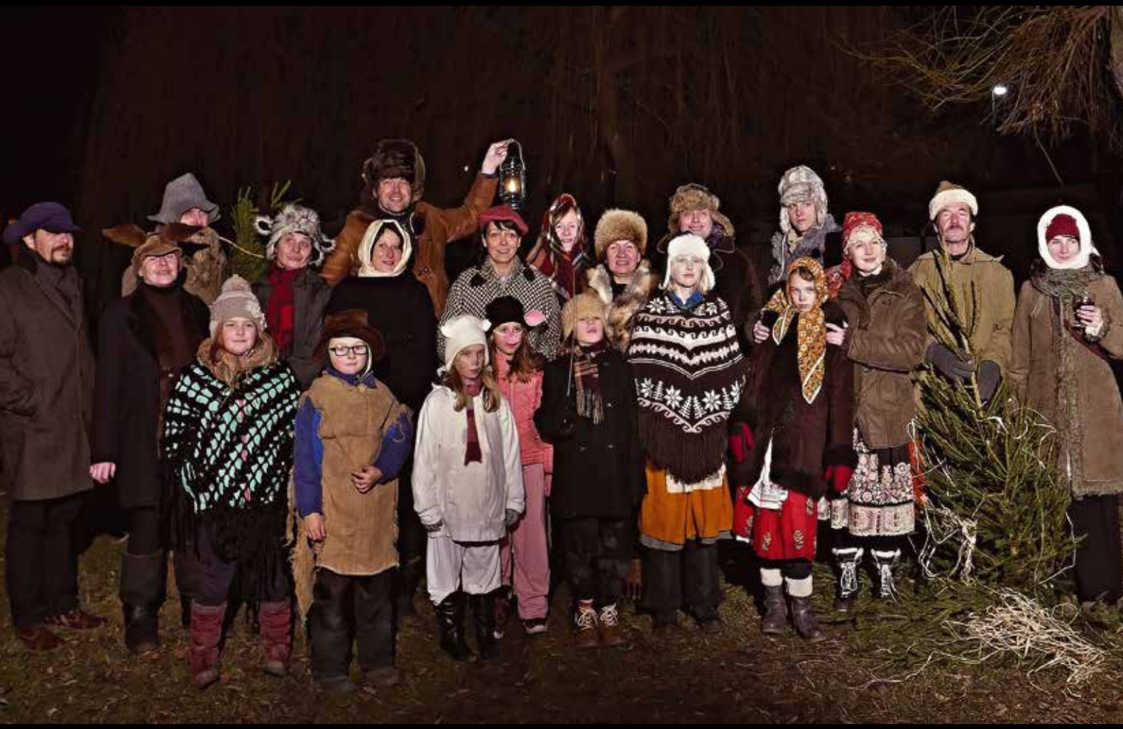
Hrusice v Buštěhradě.